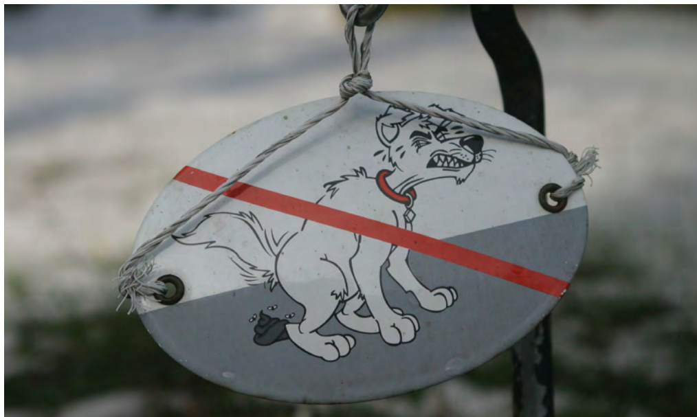
Mancher Grundstücksbesitzer versucht, auf diese Weise Abhilfe zu schaffen – dieses Schild ist eins von mehreren Beispielen im Ort, die den Zweibeinern zeigen sollen: hier bitte nicht!

Manche Hundebesitzer sind sogar so vorbildlich, die Hinterlassenschaften auch im freien Feld mit einer Tüte zu entfernen. Und wohin dann mit der Tüte? Am besten in eine Mülltonne, und am besten zu Hause.