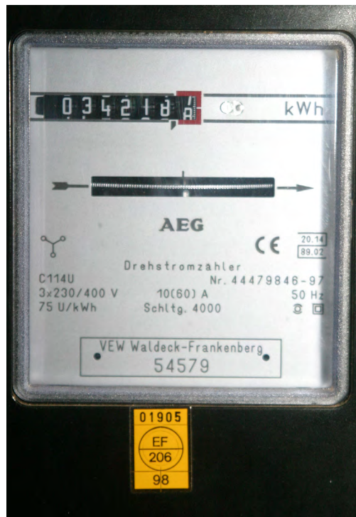
Der Stromzähler läuft und läuft. Sicher ist: Sparen ist möglich, wenn man weiß, wie.

Apropos Energie: Gerade erst haben sich rund 70 Landbesitzer als Pool-Mitglieder dazu entschlossen, jährlich einen festgeschriebenen Teil der Einnahmen aus geplanten Windrädern