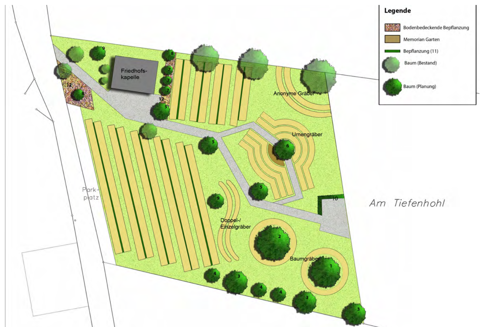
So könnte sich der neue Friedhof entwickeln. Die noch freie Rasenfläche soll aufgelockert gestaltet werden und bietet künftig Raum für verschiedene Grabtypen. Das schlägt die AG Kirchengrün vor, die als jüngstes Landliebe-Projekt erste Ergebnisse ihrer Arbeit vorgelegt hat. (Plan: K. Wagener/S. Marschke)

Der neue Friedhof war einer der wenigen Punkte, bei denen Landau beim Dorfwettbewerb noch mehr hätte herausholen können. Anlass genug, ein altes Thema wieder aufzugreifen und mit der „AG Kirchengrün“ und Nachwuchs-Fachkräften ein neues Landliebe-Projekt ins Leben zu rufen. Ein erster Plan ist inzwischen fertig und sieht auch andere Grabtypen als die bisherigen vor. Wie er umgesetzt wird, hängt vor allem davon ab, was die Landauer wünschen.